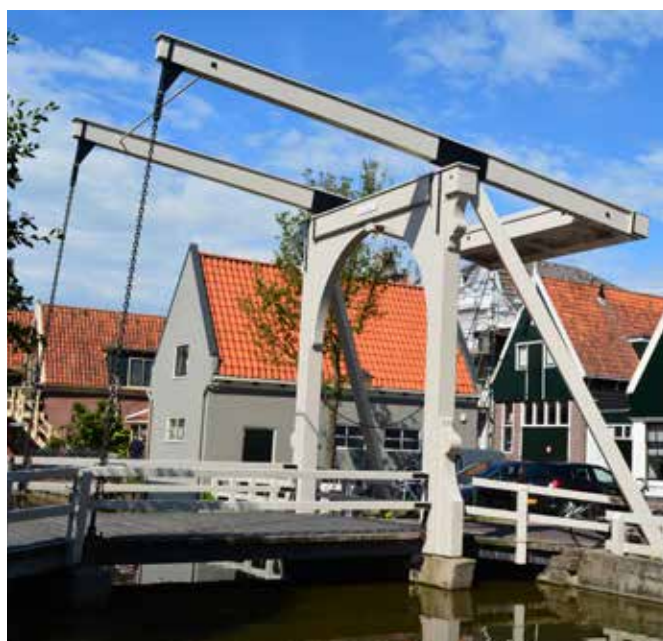
De complete bovenbouw, inclusief de hameipoort en de balans, is vernieuwd.