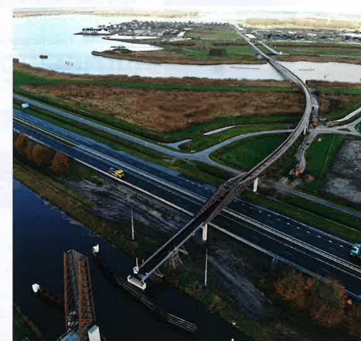
Pieter Smitbrug tussen Blauwe Stad/Winschoten.