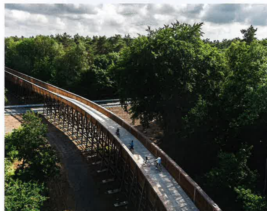
Fietsbrug 'Fietsen door de Heide' in Maasmechelen (B).